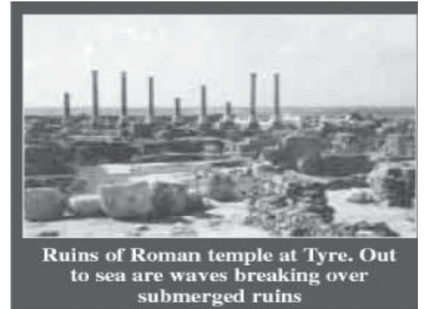
Ruins of Roman temple at Tyre. Out to sea are waves breaking over submerged ruins

அடுத்து, மேதியர் பெரிசியர் கி.மு.352ல் வந்தார்கள். இந்த அதிகாரங்களில் இவர்கள் தீருவுக்கு வந்தது பற்றி எதுவும் கூறப்படவில்லையென்றாலும் அது குறித்து அகழ்வாராய்த் தொடுத்த சான்றுகளும் ஆதாரங்களும் போதுமான அளவு உள்ளன. அநேகக் கைவினைப் பொருட்களும், நாணயங்களும் மேதியர் பெரிசியரைக் காட்டும் உருவச் சிற்பங்களும் கண்டெடுக்கப்பட்டுள்ளன.