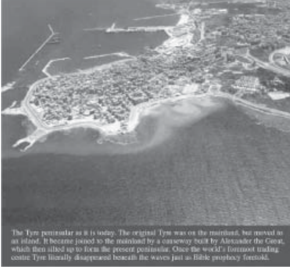
The Tyre peninsula as it is today. The original Tyre was on the mainland, but moved to an island. It became joined to the mainland by a causeway built by Alexander the Great, which then silted up to form the present peninsula. Once the world's foremost trading centre Tyre literally disappeared beneath the waves just as Bible prophecy foretold.

நிறைவேறி முடிந்த வேதாகம தீர்க்கதரிசனத்தின் சத்தியத்திற்கு எடுத்துக்காட்டாக, வேதத்தில் கூறப்பட்டுள்ள தீருவைப் பற்றின வீவரங்களை எடுத்துச் சொல்வதிலுள்ள பிரச்சினை மிக எளிதானது. இப்பொழுது தீரு பூமியில் இல்லை. நம் வாசகர்களுக்கு பண்டைய தீருவைப் பற்றிக்காட்டுவதற்கு ஒன்றுமே இல்லை.