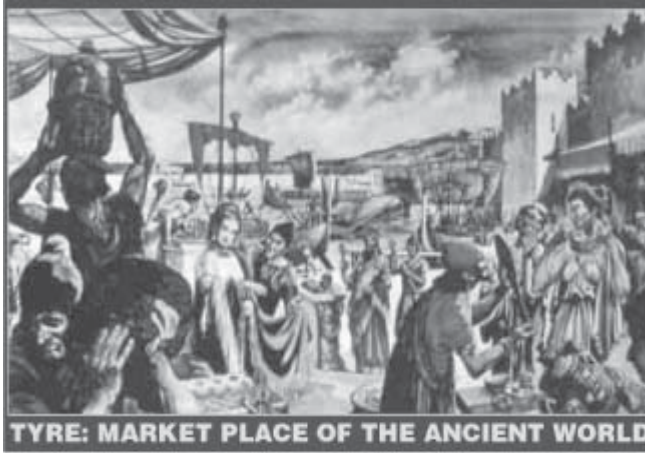
TYRE: MARKET PLACE OF THE ANCIENT WORLD

தீருவின் முடிவு ஒரே தாக்குதலினால் அல்லது நெருப்பினாலான அழிவு அல்லது மூழ்கடிக்கும் வெள்ளத்தின் விளைவாக வரவில்லை. மாறாக, “அநேகம் ஜாதிகள்” ஒரு நீண்ட காலமாக அதின் முடிவு நிகழ பங்கு கொள்வார்கள் என