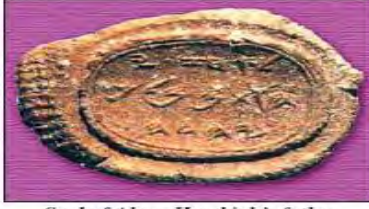
Seal of Ahaz, Hezekiah's father