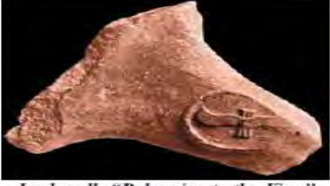
Jar handle "Belonging to the King"