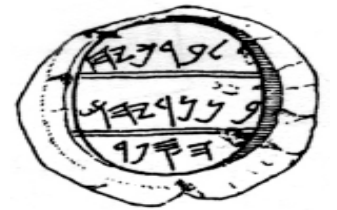
The seal of Baruch

ಅನೇಕ ಪ್ರಾಚೀನವಸ್ತು ಸಂಶೋಧನೆಗಳು ಸತ್ಯವೇದದ ಇತಿಹಾಸದ ವಿಷಯಗಳ ನಿಖರತೆಯನ್ನು ಪುಷ್ಟೀಕರಿಸಿವೆ. ಉದಾಹರಣೆಗೆ :-ಸತ್ಯವೇದದಲ್ಲಿ ತಿಳಿಸಲ್ಪಟ್ಟಿರುವ ಅನೇಕ ಜನರ ಮತ್ತು ಅಧಿಕಾರಿಗಳ ಹೆಸರುಗಳು ಮಣ್ಣಿನ ಮುದ್ರೆಗಳು ದೊರೆತಿವೆ. ಅದೇರೀತಿ ಅನೇಕ ಅಧಿಕಾರಿಗಳ ಪತ್ರಗಳು, ಒಬ್ಬರಿಂದ ಮತ್ತೊಬ್ಬರಿಗೆ ಕಳುಹಿಸಿರುವ ದಾಖಲಾತಿಗಳು ಸಹ ದೊರೆತಿವೆ. ಆ ರೀತಿ ಬರೆಯಲ್ಪಟ್ಟ ಪತ್ರಗಳು ಬರೆದವರ ಸಹಿ ಮತ್ತು ಮುದ್ರೆಯನ್ನು ಹೊಂದಿವೆ. ಅವುಗಳಲ್ಲಿ ಅನೇಕ ಮಣ್ಣಿನ ಮುದ್ರೆಗಳು ಸಂಶೋಧನೆಗಳಲ್ಲಿ ಸಿಕ್ಕಿವೆ. ಅವುಗಳಲ್ಲಿ ಕೆಲವನ್ನು ನೋಡೋಣ,