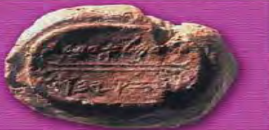
"Domla servant of Hezekiah"