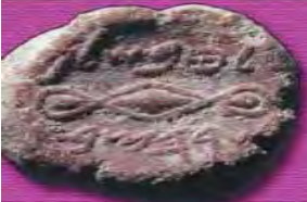
"Tobshalem Commander of the Army"